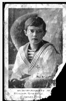
Фото царевича Алексея.

Наймушину принадлежит большая часть серии фотооткрыток, запечатлевших старый центр Ижевского завода с его обветшалыми одно-двухэтажными домами, многие из которых имели историческое значение, но не сохранились, уступив место типовым многоэтажкам.