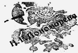
Ижевский завод. Вят. губ. ул. Троицкой и Старой ул. Увеличение портрет. до натуральн. величины.

Фотография возникла, когда люди научились использовать и сохранять изменения некоторых веществ, вызванных воздействием света. В числе первых были открыты соли серебра и исследованы еще в 18 веке.