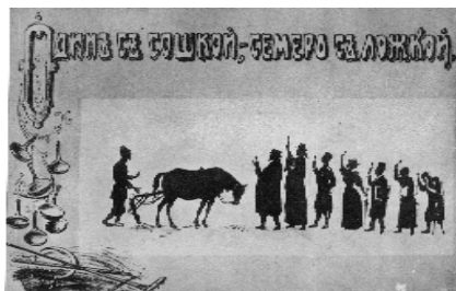
Один с сошкой, - семеро с ложкой. (Открытка начала XX века).