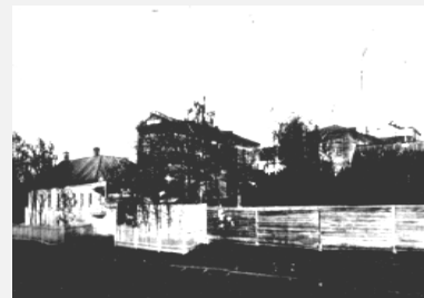
Здание фабрики Евдокимова.