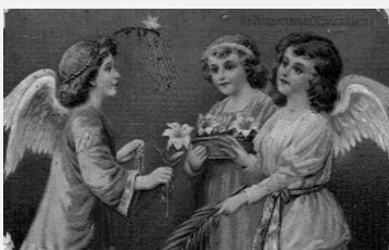
"С Рождеством Христовым", открытка начала двадцатого века.