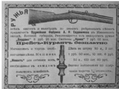
Реклама ружей фабрики А.Н. Евдокимова начала двадцатого века.