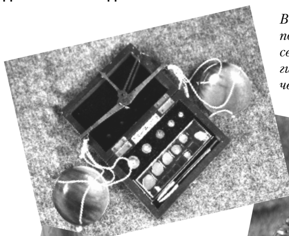
Весы аптечные, подсвечник, лампа семилинейная со стеклом, гири и разновесы, чернильный прибор.

посеребренной меди. Шведская медаль 1607 года. На пасхальном яйце для хранения разменной монеты стоит дата - 1877 год.