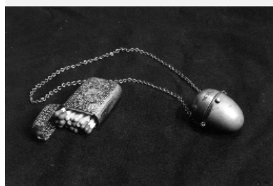
Стичный коробок и пасхальное яйцо для хранения разменной монеты.