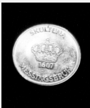
Шведская медаль 1607 года.

Когда в одном месте и в одно время собирается много умных и деятельных людей, то количество, по законам физики, неизменно переходит в качество.