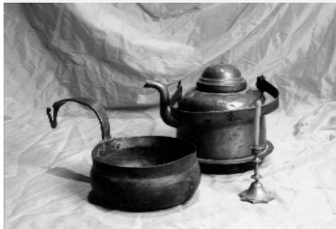
Подсвечник, ковшик и медный морской чайник.

Когда в одном месте и в одно время собирается много умных и деятельных людей, то количество, по законам физики, неизменно переходит в качество.