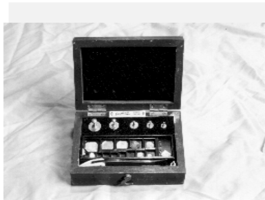
Аптекарский английский разновес.