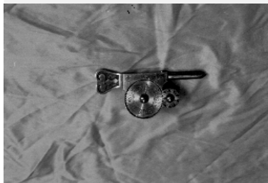
Тахометр - числовой механический прибор для измерения числа оборотов.