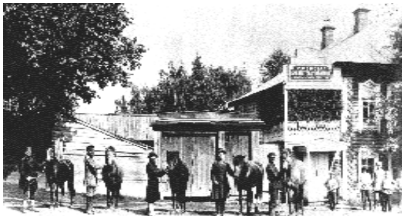
Библиотека-читальня Сарапульского земства.

обуви! Они многое постигали самостоятельно, экспериментировали с природными красителями, стараясь добиться прочной и красивой окраски. Их голубой сафьян шел на обложки альбомов, книг, в него переплетали религиозную литературу, из красного шили мусульманские ичеги, детскую и женскую обувь. Их успехи оценивали грамотами и наградами, дипломами и свидетельствами самых престижных российских ярмарок.