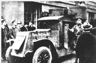
Это - боевая бронемашина.

Бронеотряды, сформированные в 1909-1911 годах, внесли неоценимый вклад в защиту Отечества на фронтах первой мировой войны, где они показали высокое мастерство и отличную боевую подготовку. Там где на фронте появлялись бронеотряды, там был успех, там была победа. Благодаря им было спасено немало солдатских жизней.