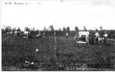
Батарея, к бою!

Бронеотряды, сформированные в 1909-1911 годах, внесли неоценимый вклад в защиту Отечества на фронтах первой мировой войны, где они показали высокое мастерство и отличную боевую подготовку. Там где на фронте появлялись бронеотряды, там был успех, там была победа. Благодаря им было спасено немало солдатских жизней.