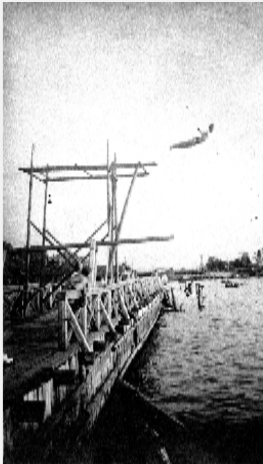
Ижевский пруд - источник здоровья.