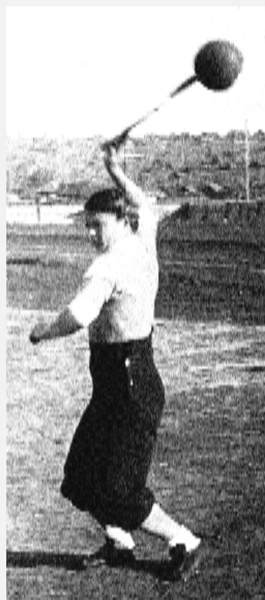
На ижевском стадионе "Зенит".