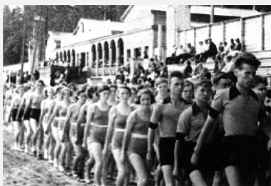
Отдыху трудящихся в городском парке: "Физкульт - УРА!!!"