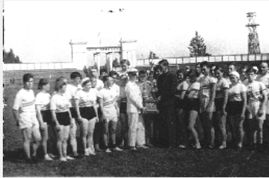
Открытие парка культуры и отдыха им. С.М.Кирова в Ижевске.