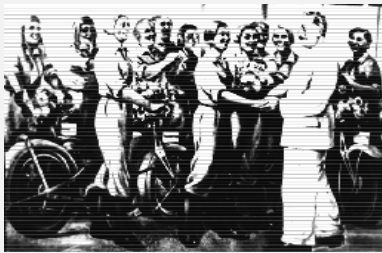
С "отцом народов"...

1937 год, вошедший в российскую историю как время разгула репрессий, тем не менее, был ознаменован трудовыми победами в цехах Ижевского мотозавода и успехами на спортивных соревнованиях.