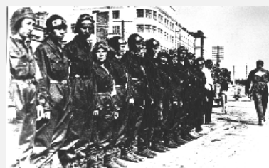
Во имя славы Отечества!

24 июля 1936 года на мотоциклах "Иж-7" от Дома правительства участники пробега, отрапортовав о готовности первому секретарю обкома партии и выслушав напутствия и пожелания, под звуки сводного духового оркестра, двинулись в путь, чтобы на два дня сократив время пробега, финишировать в Москве 4 августа. Восемь суток мчались по бездорожью отважные мотоциклистки. Выдержали и люди, и техника. Команде вручили приз за надежность ижевских мотоциклов, а участников наградили ценными подарками.