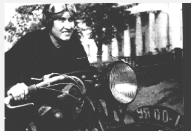
Женщина за рулем - быть рекорду!