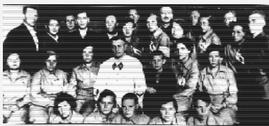
Прием. т. М. И. ТУХАЧЕВСКИМ УЧАСТНИКОВ ЖЕНСКОГО МОТОПРОБЕГА Ижевск — Москва 1936 г.

1937 год, вошедший в российскую историю как время разгула репрессий, тем не менее, был ознаменован трудовыми победами в цехах Ижевского мотозавода и успехами на спортивных соревнованиях.