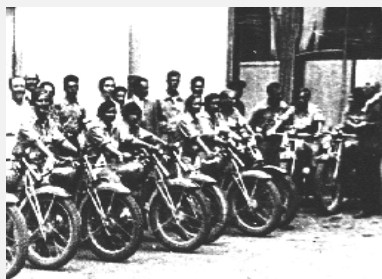
Имена этих отважных ижевчанок вписаны в Историю.