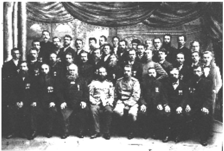
Инструментальный цех Ижевского оружейного завода. Фото 1909 года.

Как никто другой он умел стойко сносить удары судьбы. Даже будучи тяжело больным, он мужественно переносил страдания и умер без единого стога 9 мая 1983 года в День Победы.